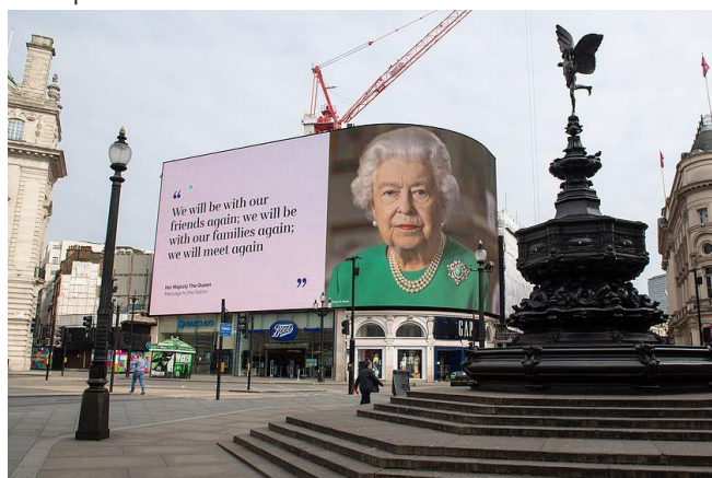
Mensaje de la reina Isabel II en Piccadilly Circus.

Gales, e Irlanda del Norte), sin embargo, muchos negocios y oficinas permanecen cerrados.