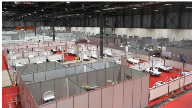
El hospital de campaña instalado en Ifema, feria de Madrid.

El primer caso de COVID-19 en España se confirmó el 31 de enero de 2020. El Gobierno de España declaró el estado de emergencia el 14 de marzo, expidiendo una orden de confinamiento a nivel nacional. Se ordenó el cierre durante dos semanas de comercios no esenciales, colegios, hoteles y alojamientos para turistas. Posteriormente, se permitió la vuelta al trabajo de los sectores de la construcción y producción, aunque otras restricciones se prorrogaron a los ciudadanos. España también cerró sus fronteras externas con sus vecinos europeos. El personal sanitario y los ancianos que viven en residencias han registrado altas tasas de contagio. El 25 de marzo, el número de fallecidos sobrepasó el de China continental. Se espera que el número total de casos haya sido subestimado debido a la falta de pruebas e información.